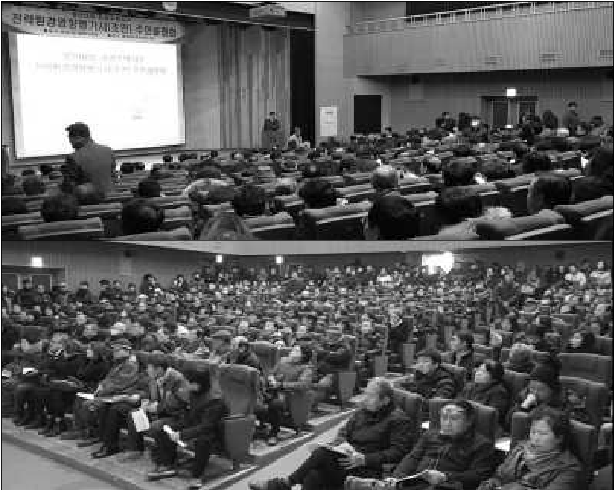
(그림 7) 주민설명회 전경