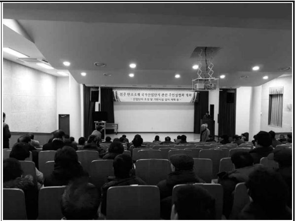
동산동 주민센터 강당 내(1층)