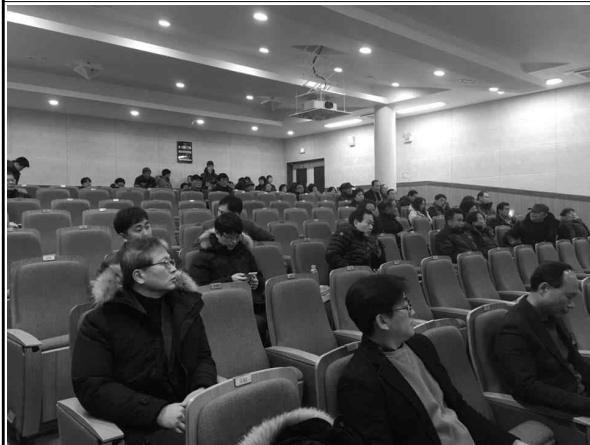
동산동 주민센터 강당 내(1층)