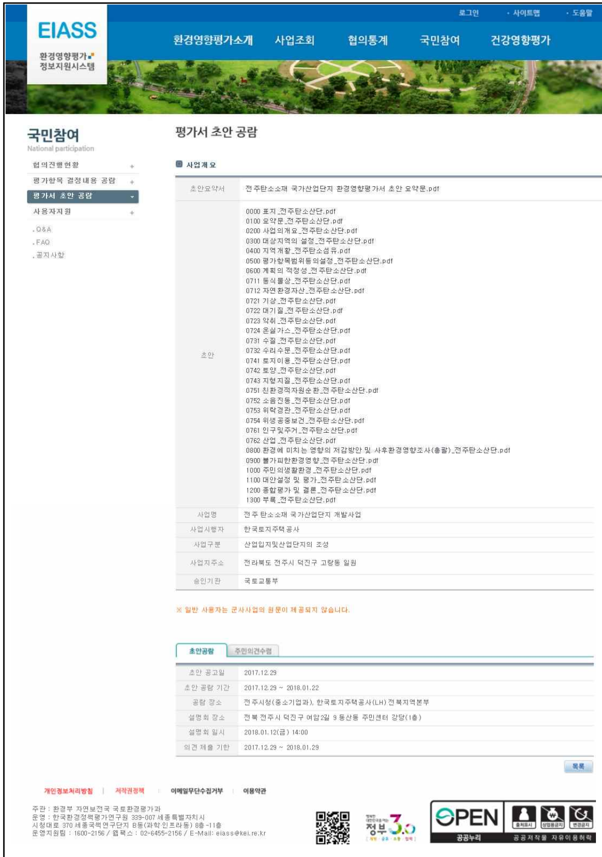
(그림 2-5) 환경영향평가(초안) 등록(환경영향평가 정보지원시스템)