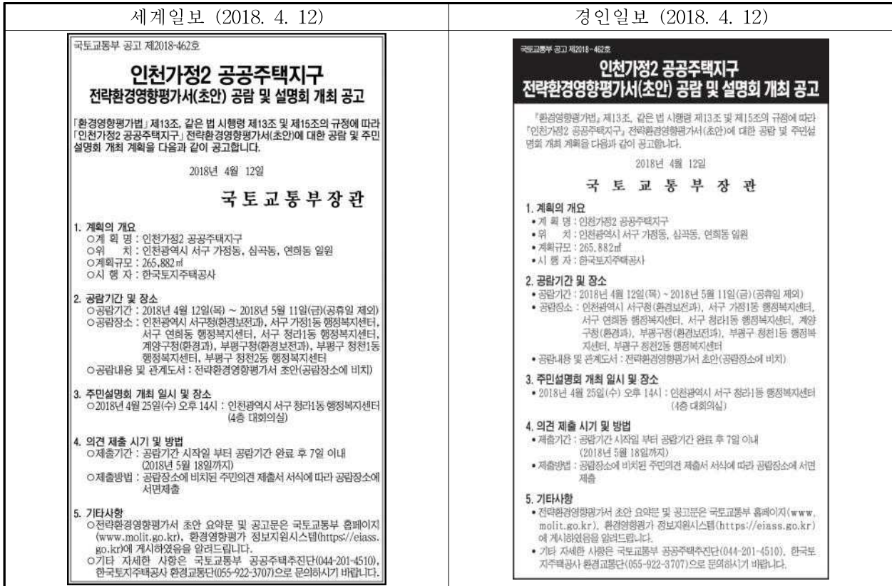
(그림 3) 신문광고