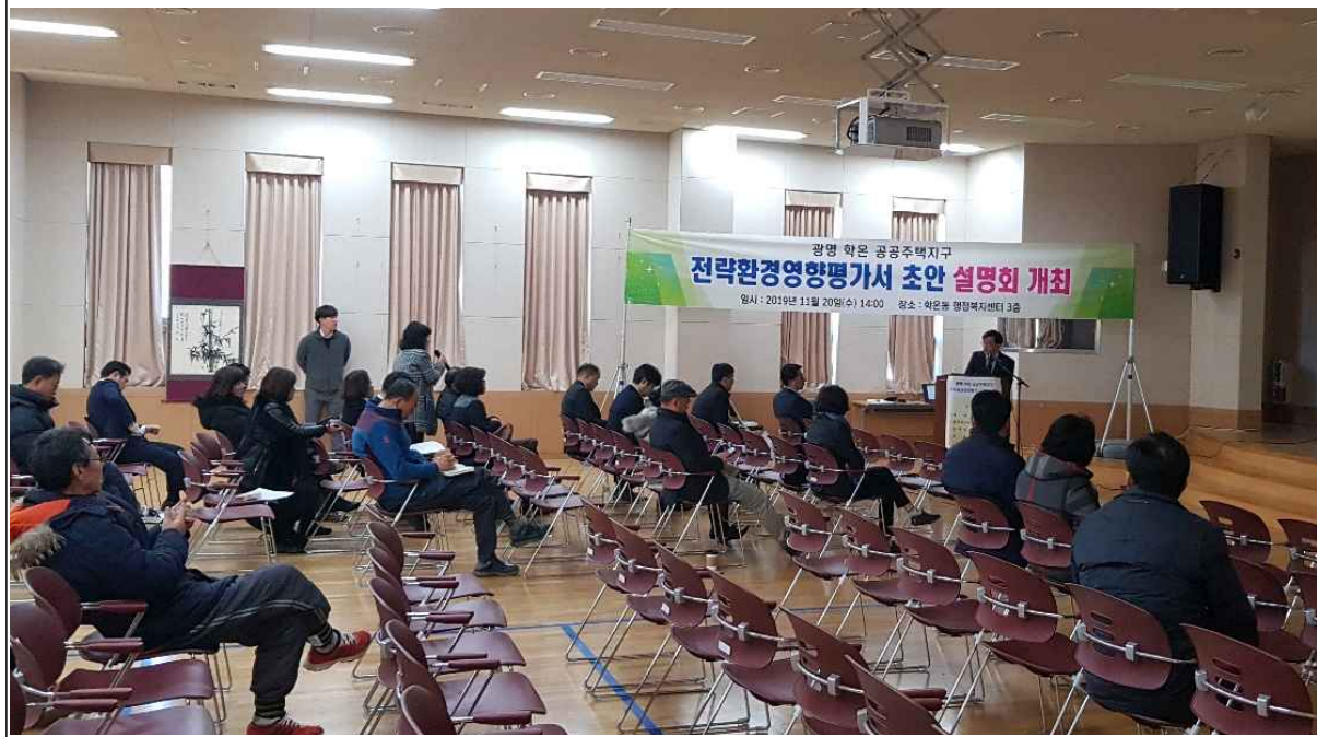
(그림 5) 설명회 개최 사진