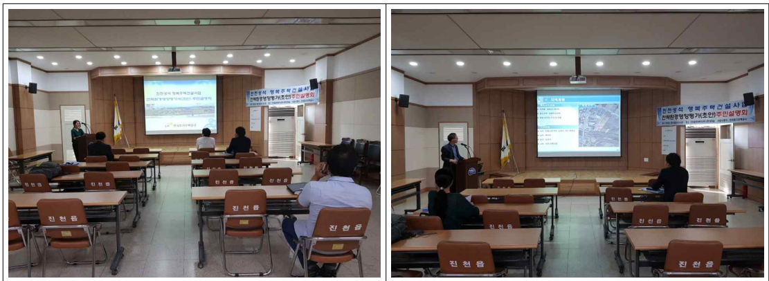
< 주민설명회 개최전경 >