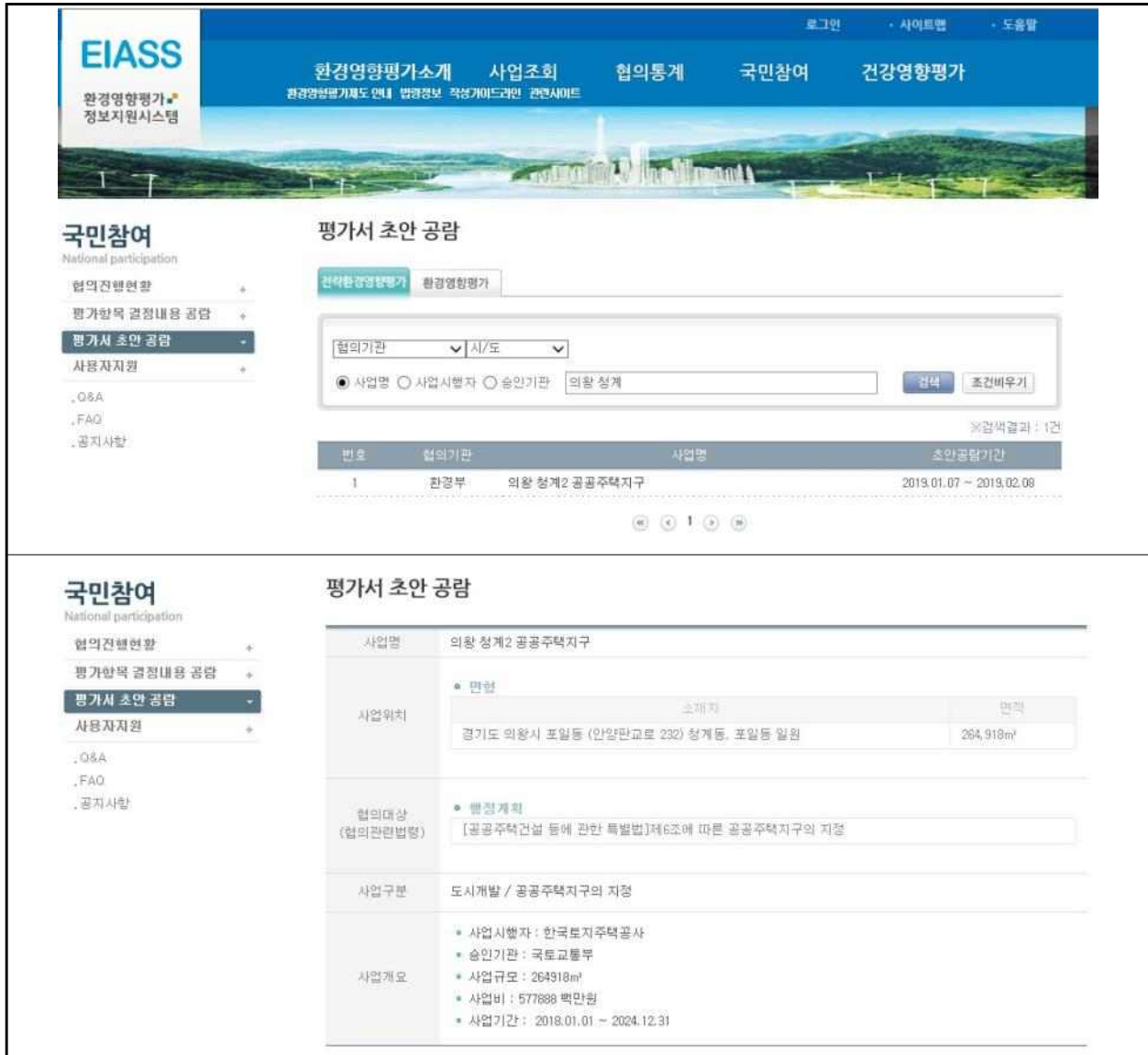
(그림 5) 환경영향평가정보지원시스템(www.eiass.go.kr) 게재