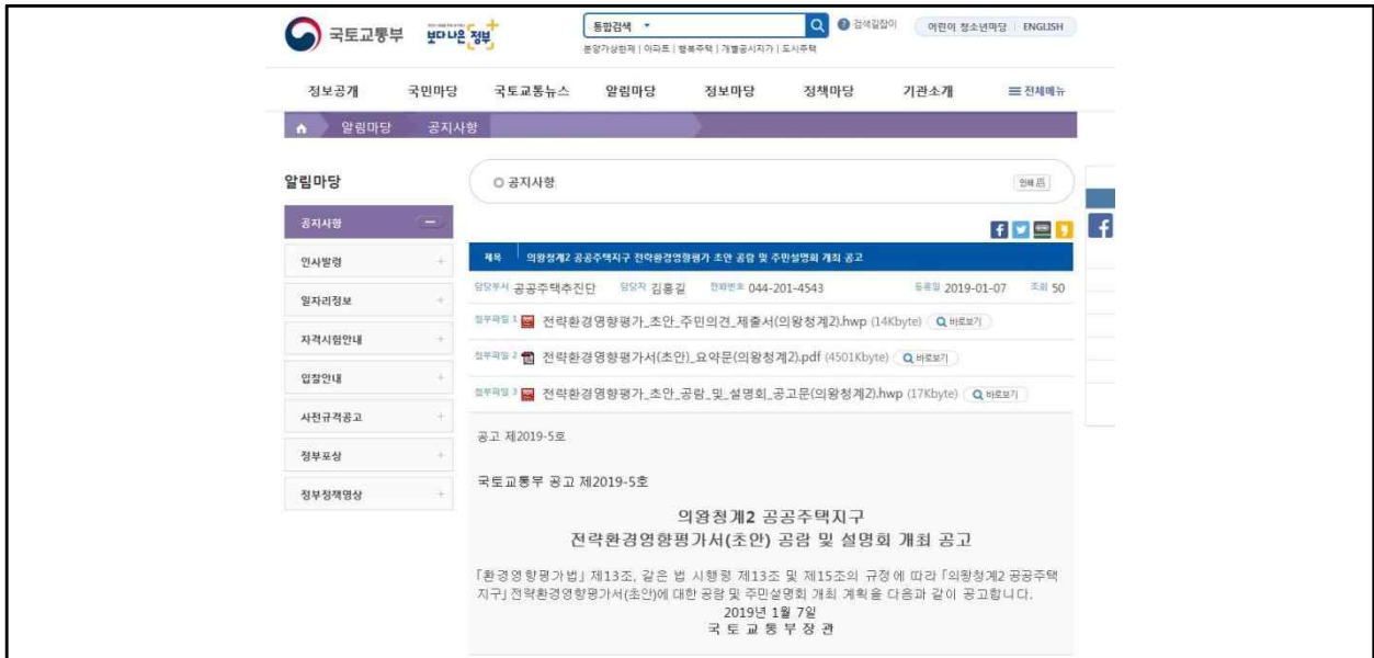
(그림 4) 국토교통부 홈페이지(www.molit.go.kr) 게재