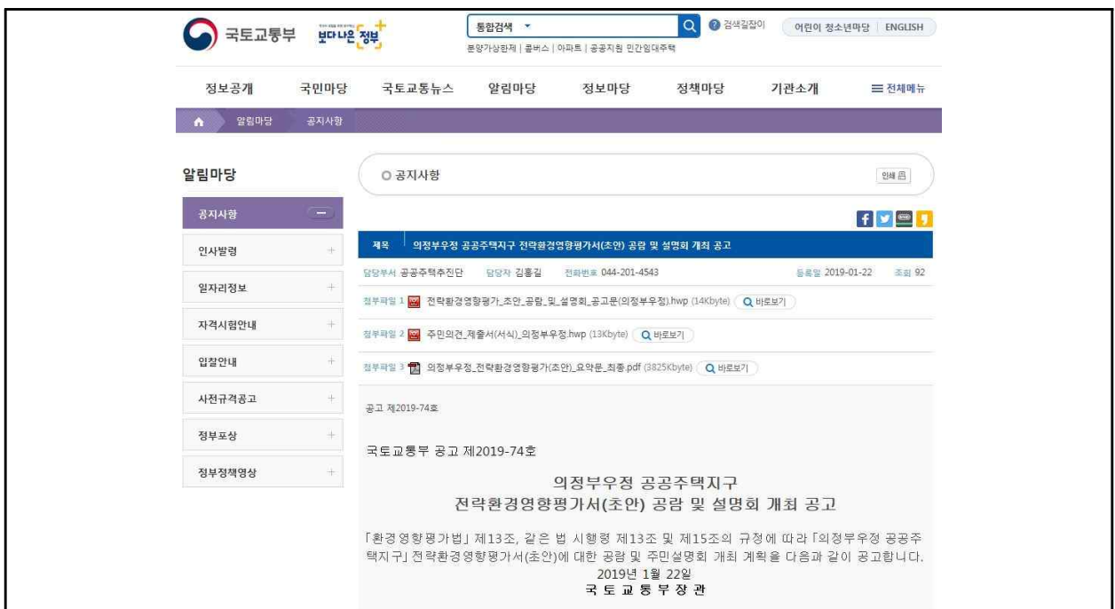
(그림 4) 국토교통부 홈페이지(www.molit.go.kr) 게재