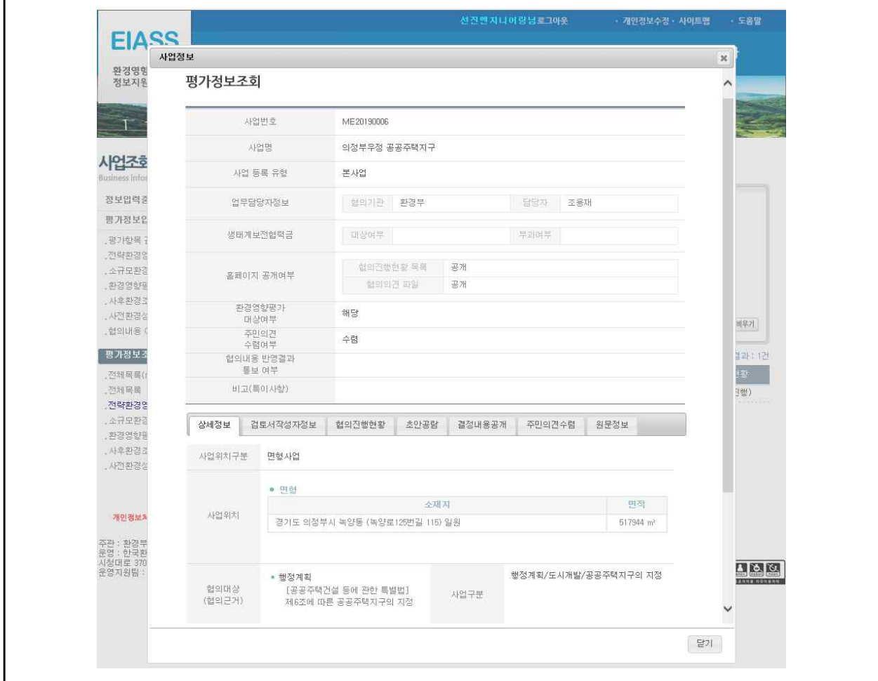
(그림 5) 환경영향평가정보지원시스템(www.eiass.go.kr) 게재