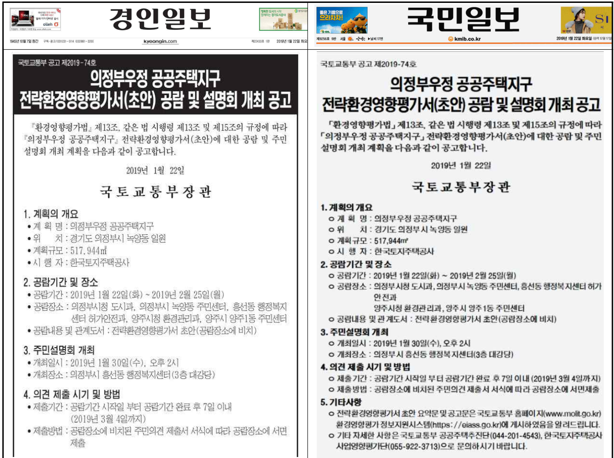
(그림 3) 신문공고