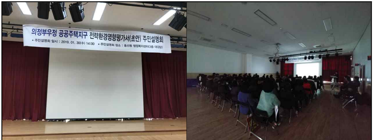
(그림 6) 주민설명회 전경