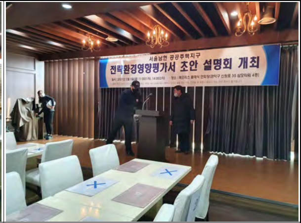
설명회(2차) 개최 전 방역작업 실시