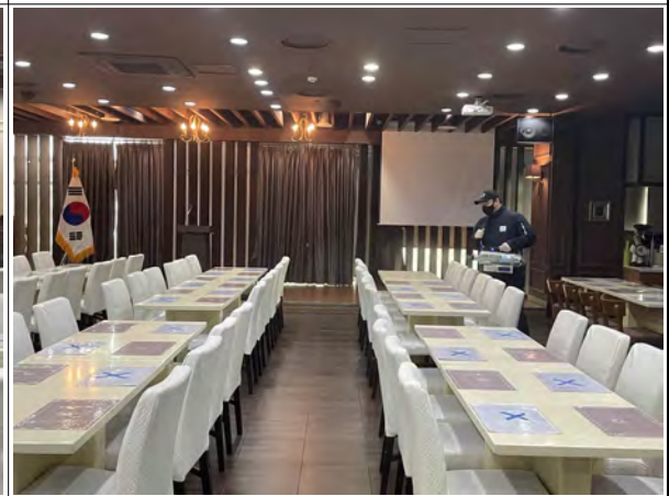
설명회 개최 후 방역작업 실시