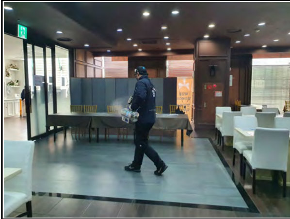
설명회(1차) 개최 전 방역작업 실시