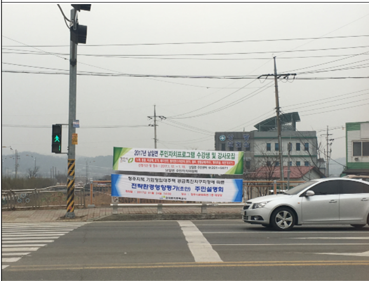
③ 상당보건소앞 사거리