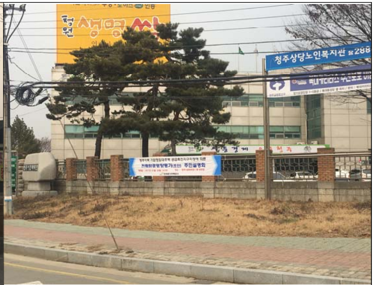
② 청주시 문화회관