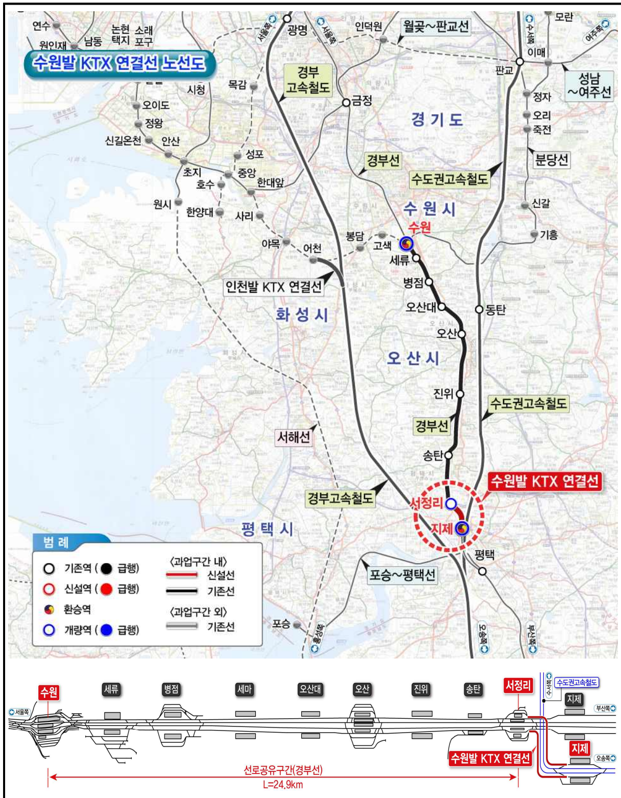
[그림 1.4-1] 정거장 및 사업노선 위치도