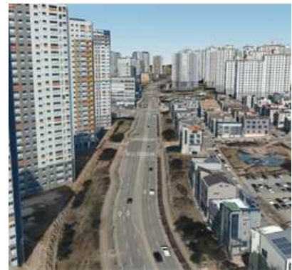
< 국토지리정보원에서 시범 구축('20)한 오산시 일대 3차원 공간정보 사례 >