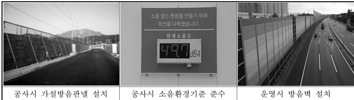
공사시 가설방음판넬 설치