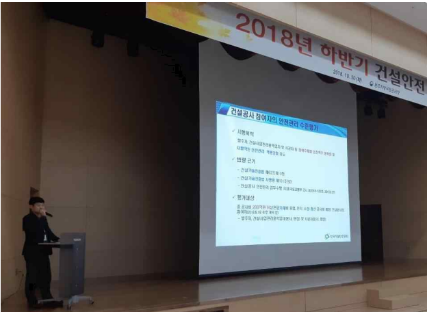
건설시공 및 안전강화 방안