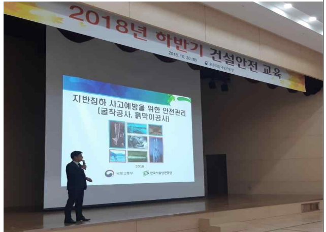
지반침하 사고예방 교육