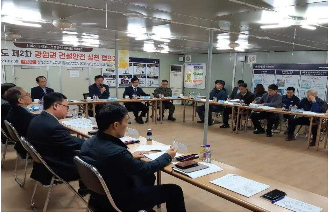
2018년도 제2차 강원권 건설안전 실천협의회