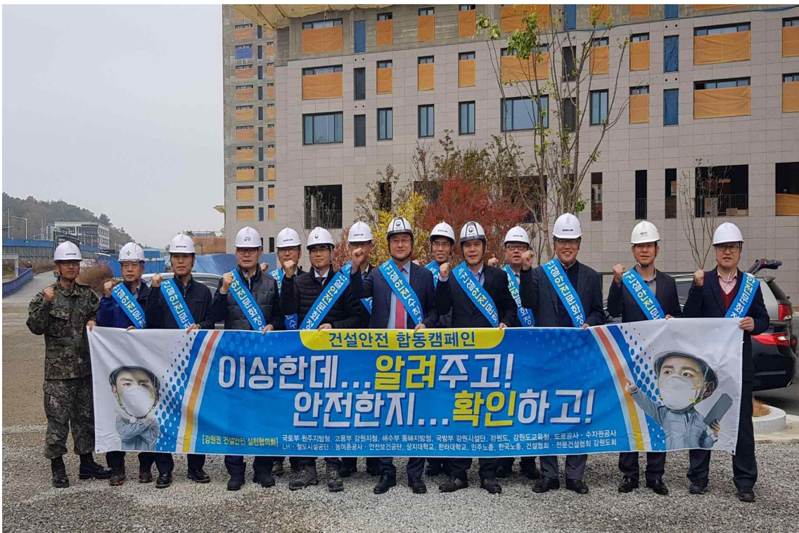
10월 건설안전 합동 페인