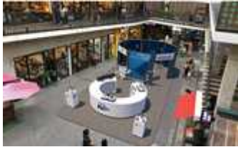
(오프라인 피규어 제작)