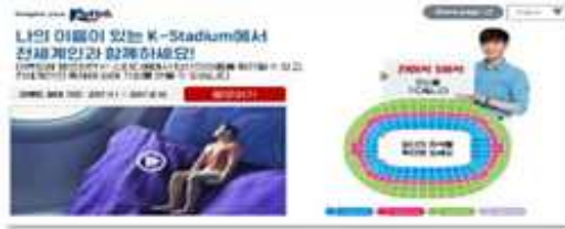
(온라인 피규어 응모 및 제작)