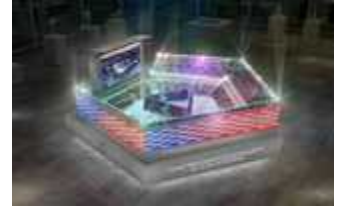
(피규어 상상스타디움 배치)