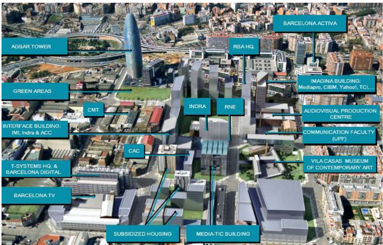
<22@Barcelona 프로젝트 재생사업 조성계획>