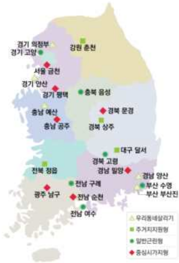
< '19년 상반기 선정결과 >

* (우리동네살리기, 주거지지원형, 일반근린형) 5~15만㎡, 국비 50~100억 원, 사업기간 3~4년