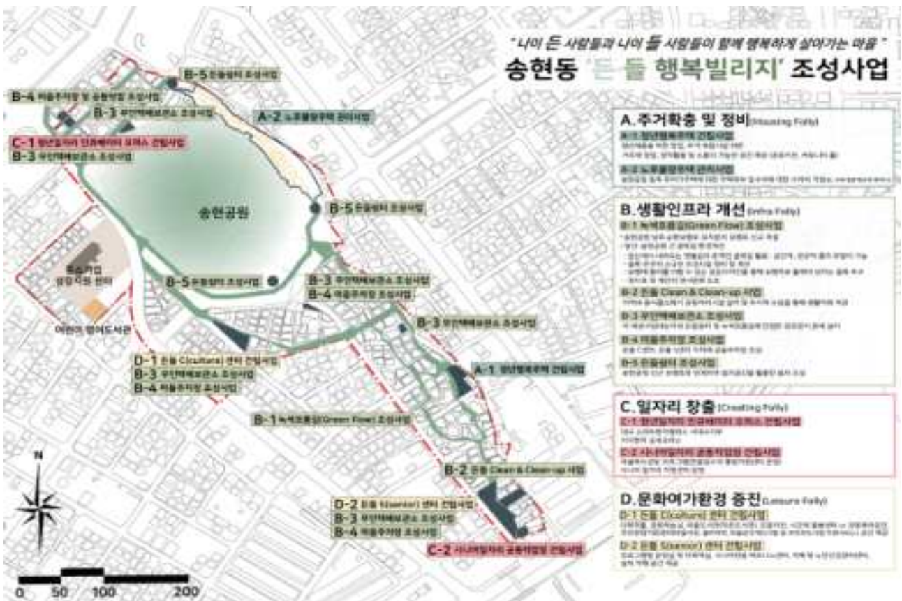
< 대구 달서구 송현동 도시재생 뉴딜사업 계획 >