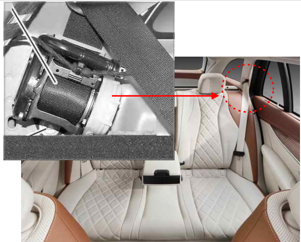
뒷좌석 좌측 안전벨트 프리텐셔너