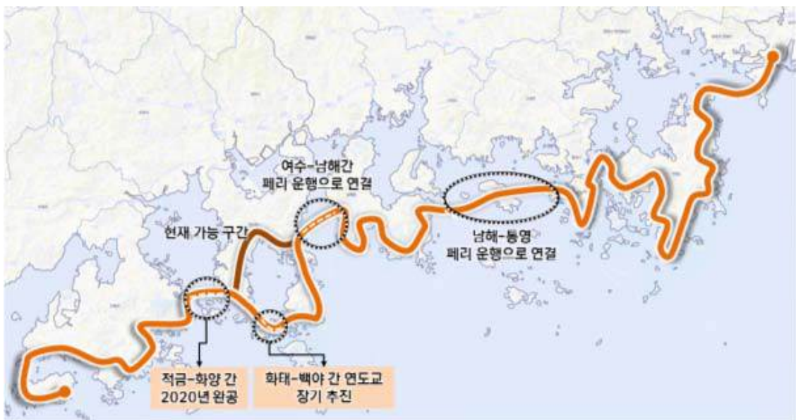
< 해안루트 구상 >