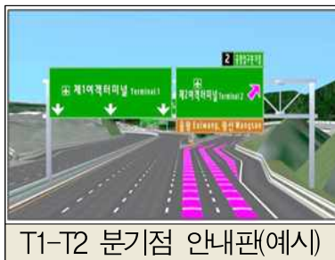
T1-T2 분기점 안내판(예시)