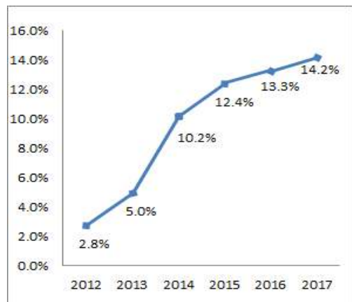
【연도별 지역인재 채용율 (%)】

□ 한편 지방이전 공공기관의 17년도 지역인재 채용률은 14.2%로 16년 13.3%에 비해 소폭 증가하였다.