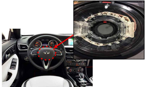
스티어링 칼럼 모듈