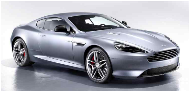
애스턴 마틴 DB09