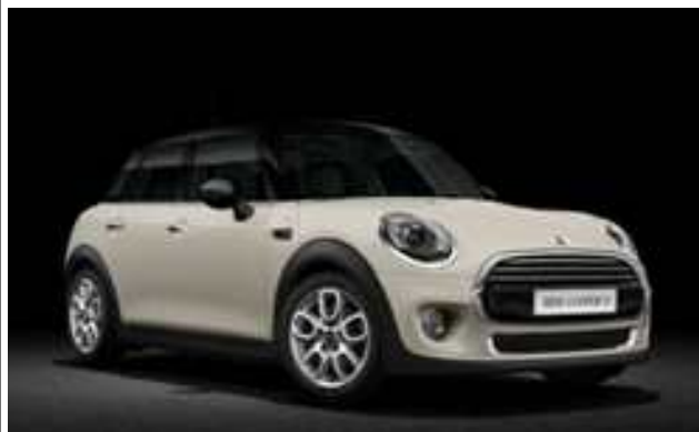
MINI 쿠퍼 D 5 도어