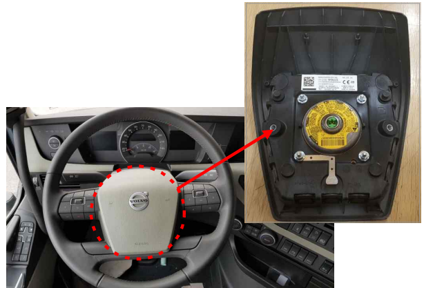
운전석 에어백 인플레이터