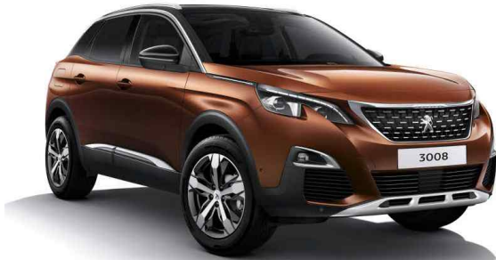
Peugeot 3008 1.6 Blue-HDi