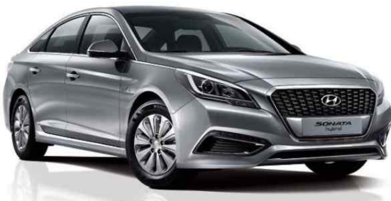
쏘나타 하이브리드(LF HEV)