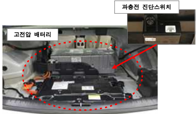
고전압 배터리 과충전 진단스위치