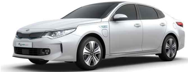
K5 플러그인 하이브리드(JF PHEV)