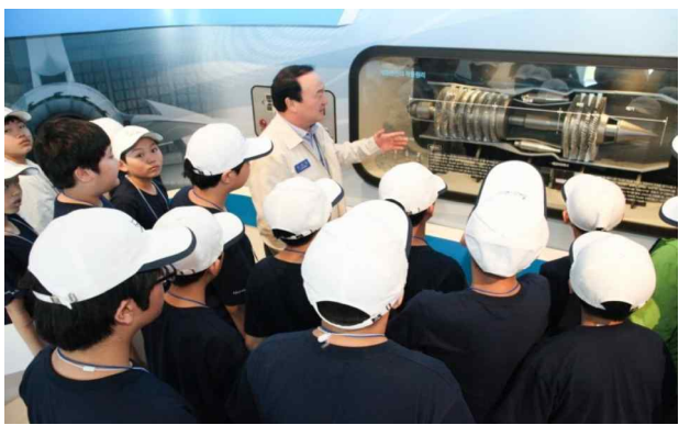
항공기 엔진에 대하여