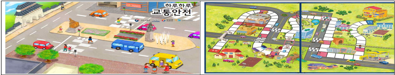
< 스티커북 및 보드게임 등 놀이형 교통안전 교육 교재 >