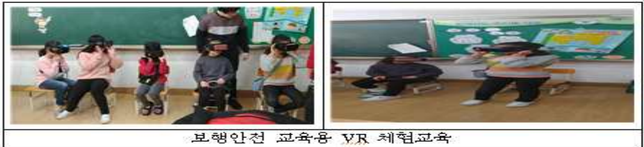
보행안전 교육용 VR 체험교육