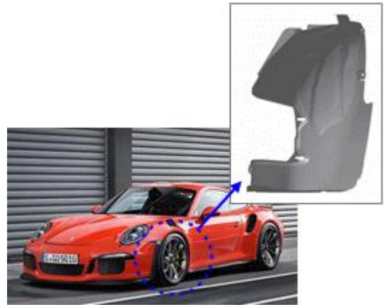
전방 휠 하우스 링 라이너