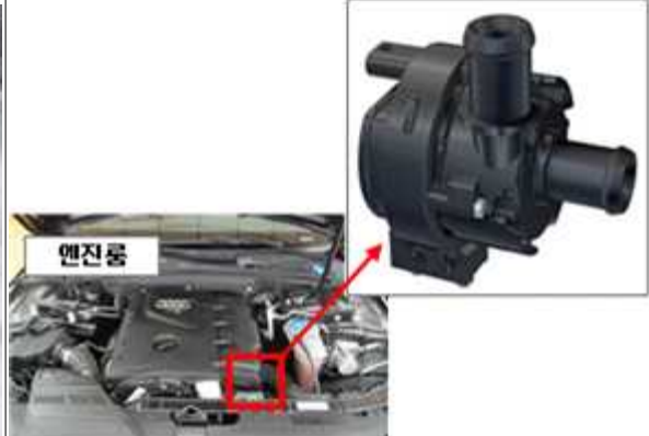
보조 냉각수 펌프