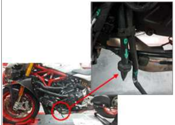
드레인 호스 배열