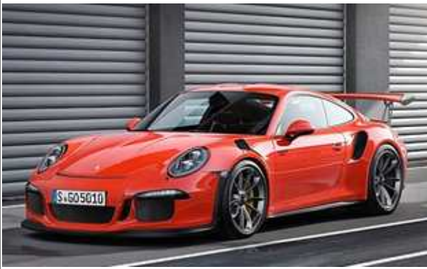
911 GT3 RS