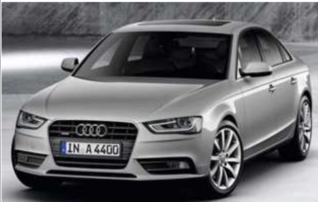
A4 40(2.0) TFSI quattro