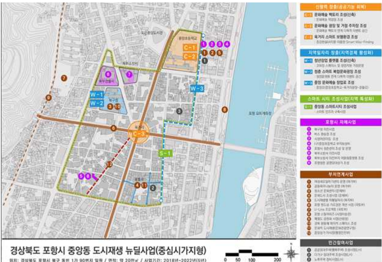
< 종합 구상도 >