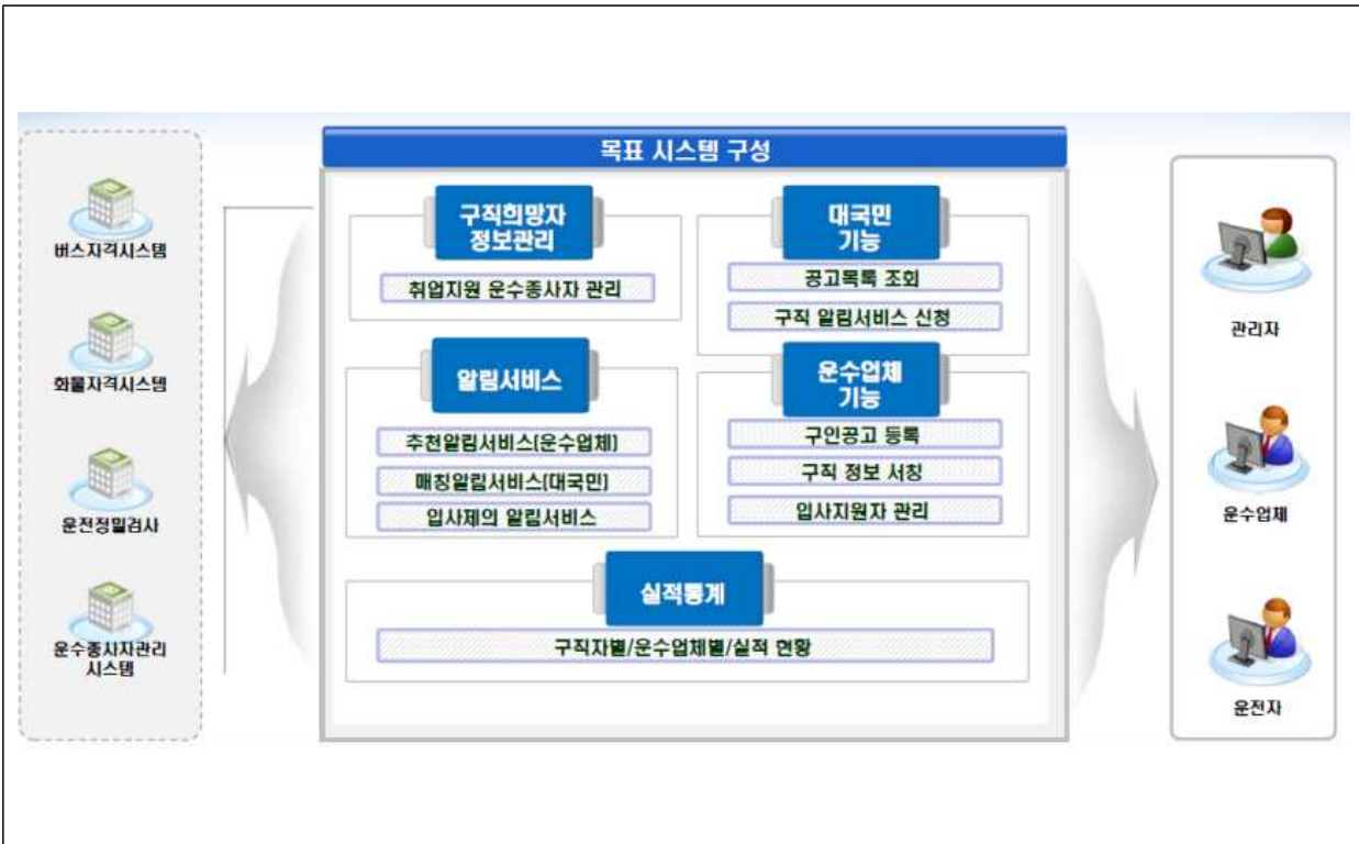
[사진 설명] 운수종사자 취업지원 시스템 구성도