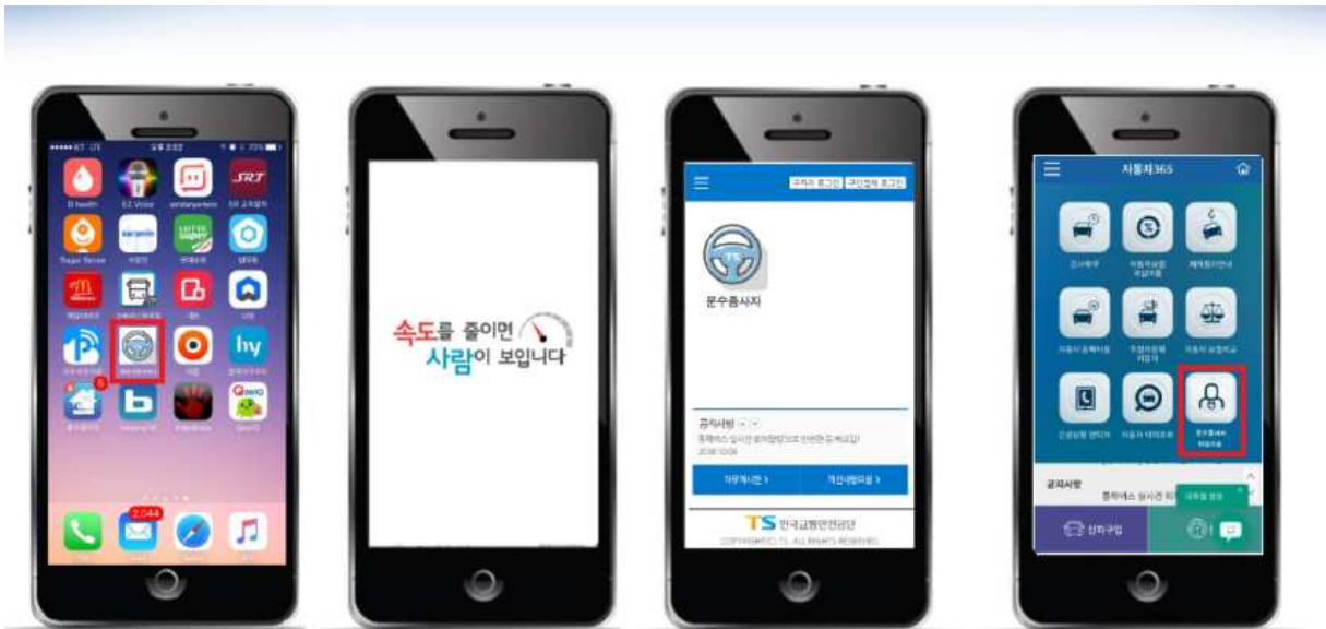
[사진 설명] 운수종사자 취업지원 앱