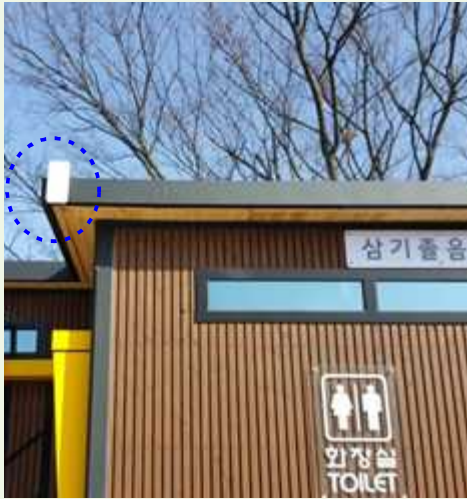
[공공 와이파이 설비]