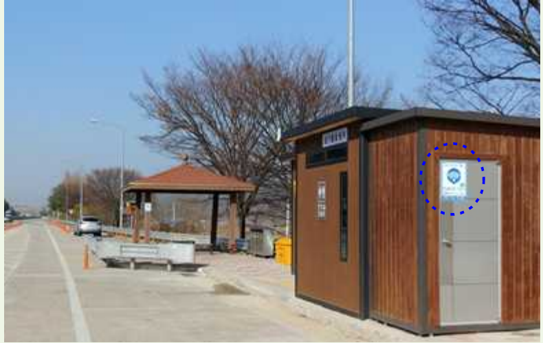
[공공 와이파이 안내표지]