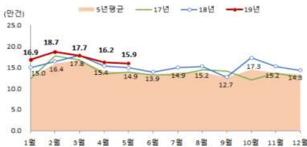
< 월별 전국 전월세거래량 >