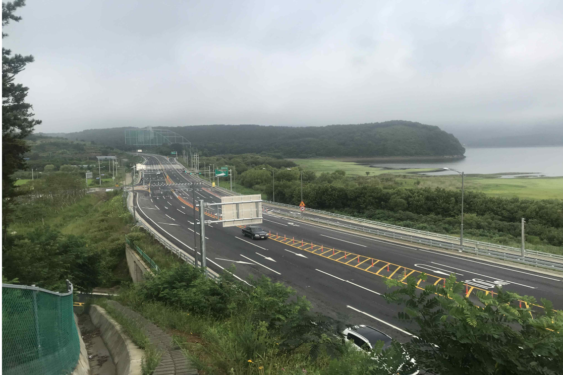
보령-청양(제1공구)도로건설공사 개통구간 전경