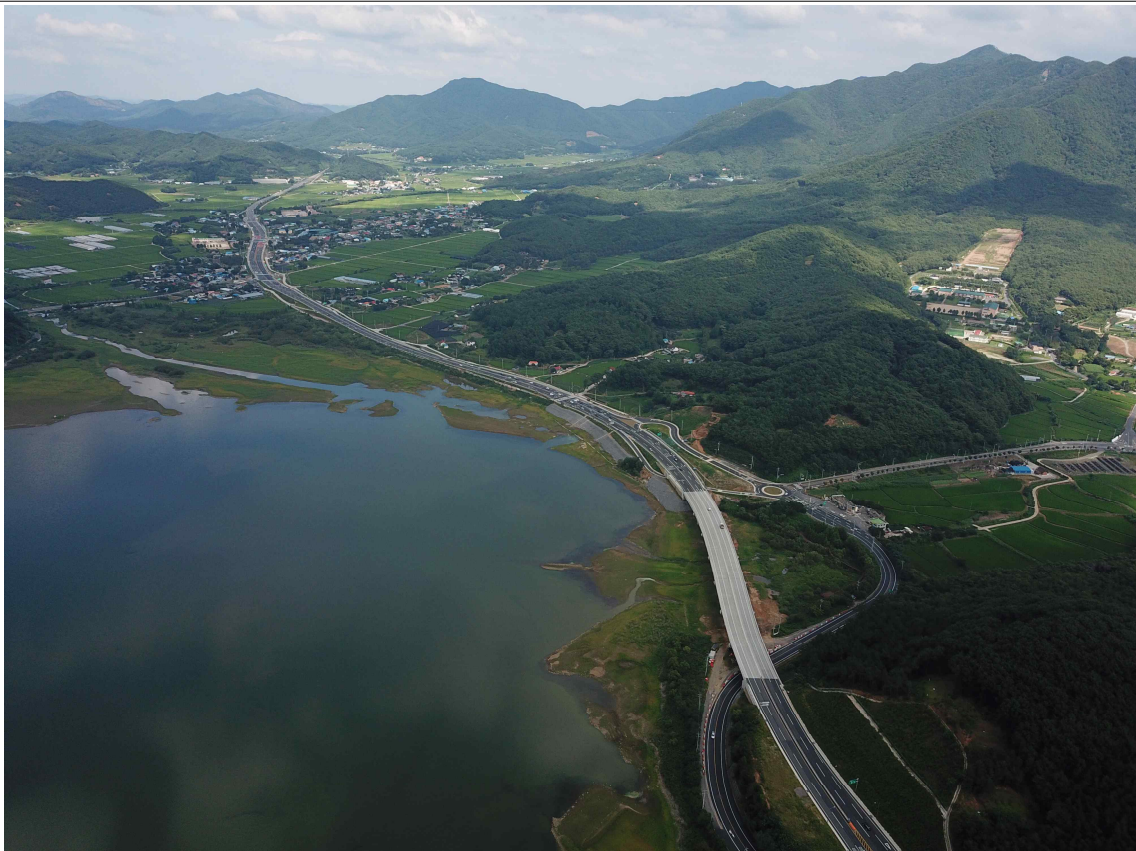
보령-청양(제1공구)도로건설공사 개통구간 전경