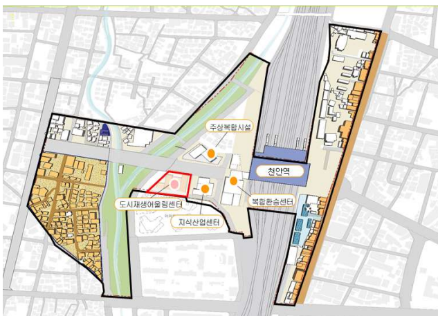
< 천안역세권 재생사업 부지 >