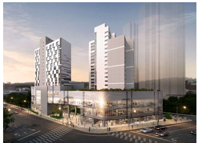
< 어울림센터 조감도 >