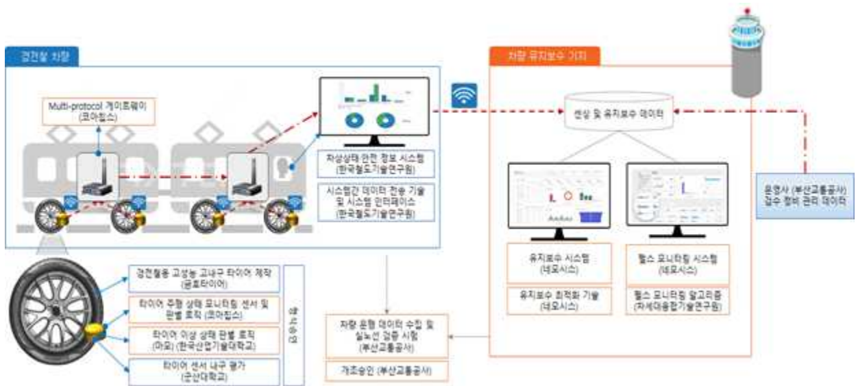
< 연구개발 추진전략 구성도(1, 2세부 연계 기술개발 인터페이스 포함) >