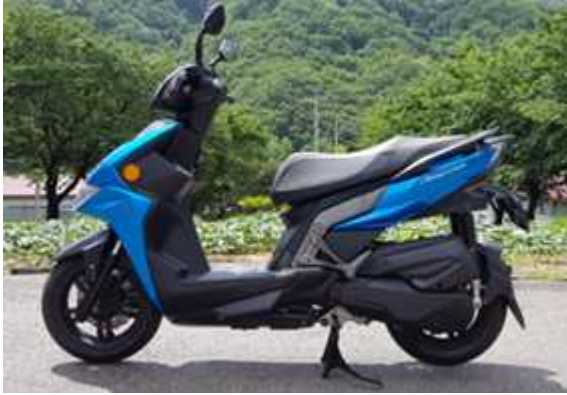
RACING S 150