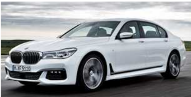
BMW 740d xDrive