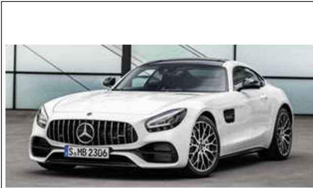
AMG GT 63 S 4MATIC+