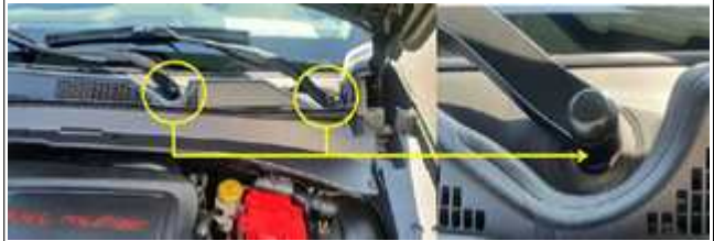
전방 와이퍼 암