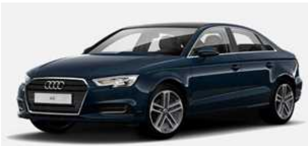
A3 40 TFSI