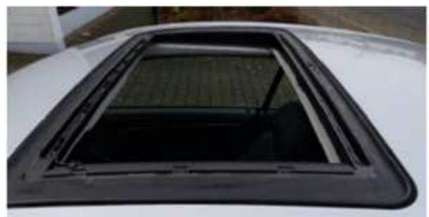
선루프 유리 패널