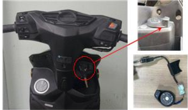
USB 충전 장치