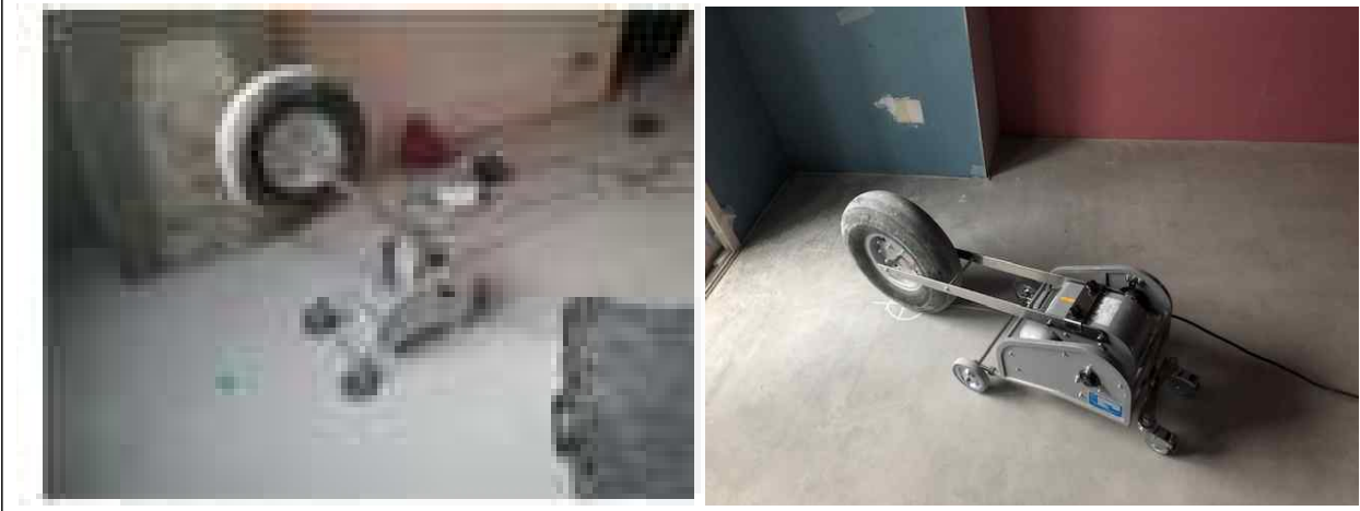
뱅머신 소음 측정