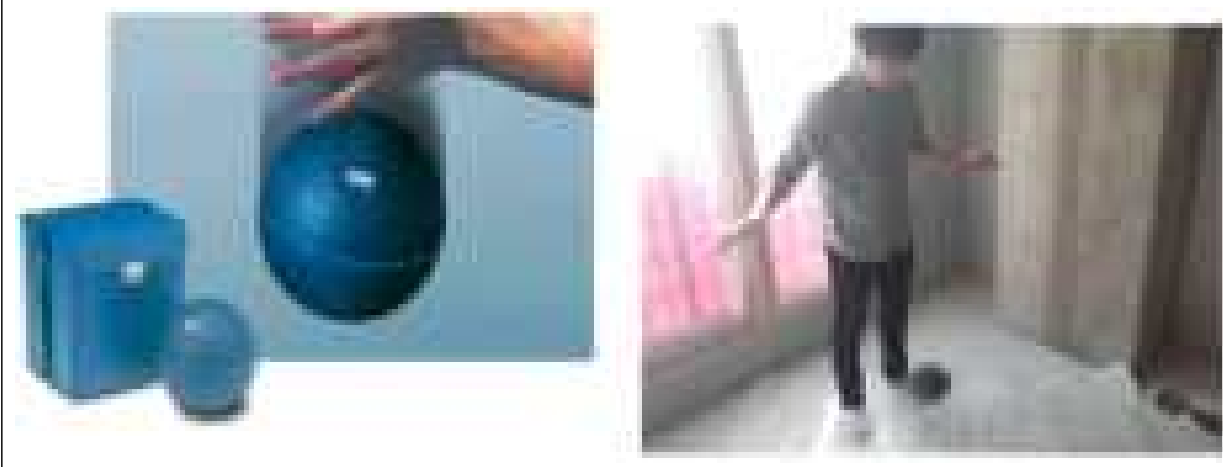
임팩트볼 소음 측정