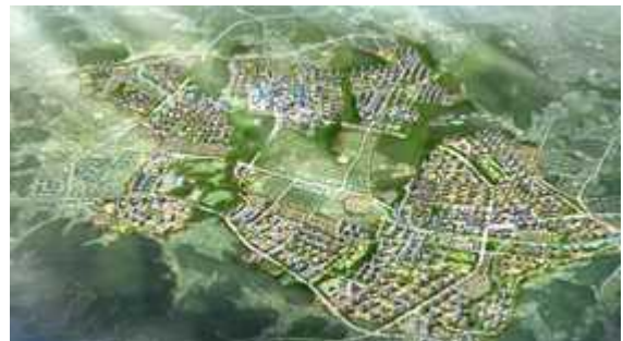
< 인천 검단 (2기 신도시) >