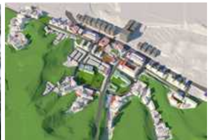
< 성남 북정1 >