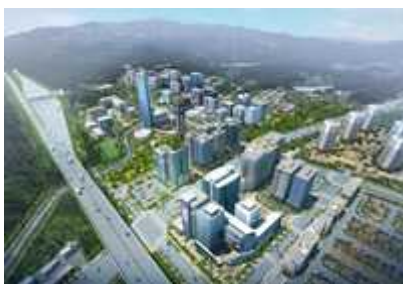
< 과천지식정보타운 >

** 수원당수(8.2천호), 용인플랫폼(1.1만호), 용인언남(6.5천호)