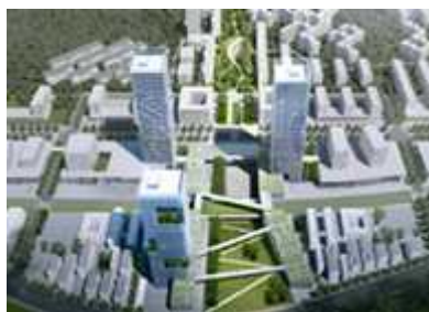
< 하남 교산(랜드마크) >