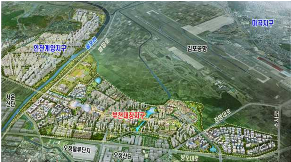
< 부천대장지구 >