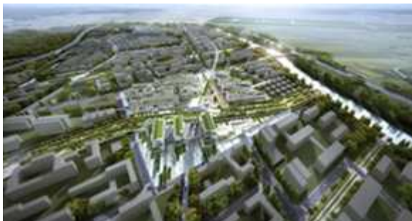
< 인천 계양 (3기 신도시) >