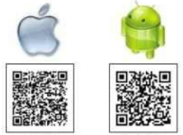
아이폰 App 스토어에서 '척척해결서비스' 검색 안드로이드 Play 스토어에서 '척척해결서비스' 검색