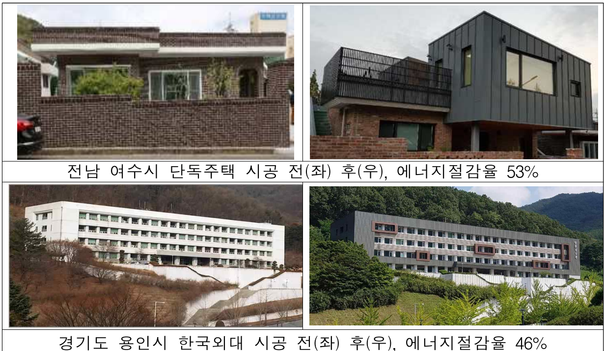
전남 여수시 단독주택 시공 전(좌) 후(우), 에너지절감율 53%