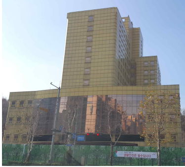
(정비전) 500병상 규모 종합병원

(중단)'97.8→ (선도사업)'15.12→ (철거)'18.9→ (착공)'19.8→ (분양)'21.11→ (입주)'24.1