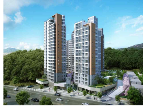
(정비후) 공동주택((59㎡, 84㎡), 174호