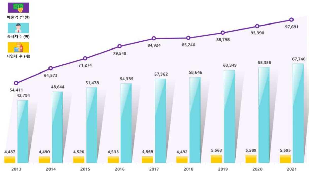
< 공간정보 관련 주요 산업규모 현황 >

* 공간정보산업은 사물의 위치와 관련된 수치지도, 지적도, 3차원 지도 등을 생산·가공·유통하거나 다른 분야와 융·복합하여 서비스를 제공하는 산업