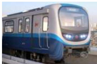
2호선 48칸 (’21년 공급 완료)