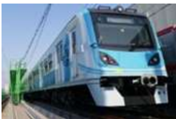
1호선 180칸 (’16년 공급 완료)