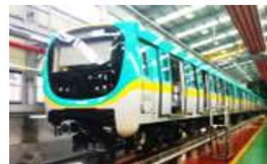
3호선 256칸 (공급완료, 시운전 중)