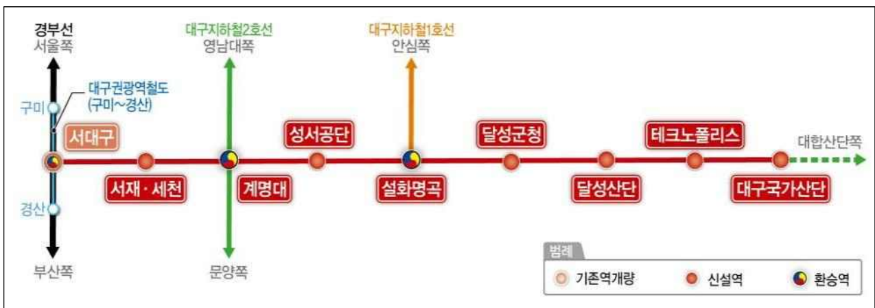
< 대구산업선 노선 약도 >