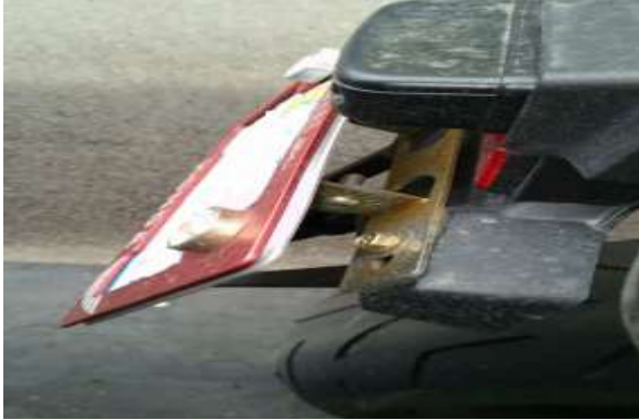
〈이륜자동차 - 꺾기 번호판〉