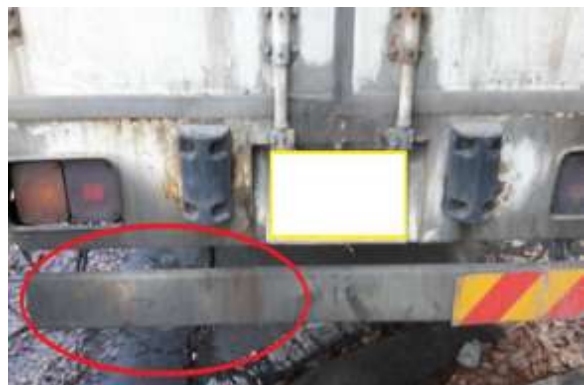
<화물차-후부 반사지 미부착>