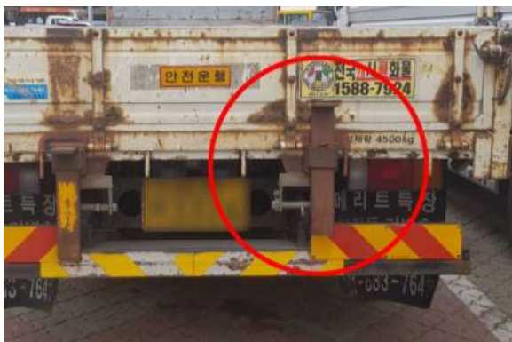
<화물차-적재함 판스프링 설치>