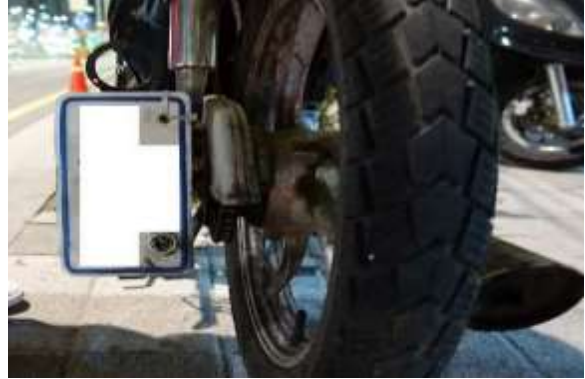
〈이륜자동차 - 번호판 부착위치 위반〉