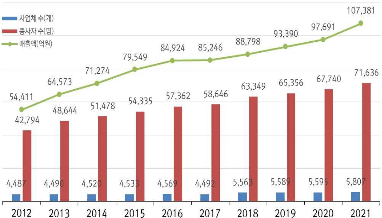
< 공간정보 산업규모 주요현황 >

* 공간정보산업은 사물의 위치와 관련된 수치지도, 지적도, 3차원 지도 등을 생산·가공·유통하거나 다른 분야와 융·복합하여 서비스를 제공하는 산업