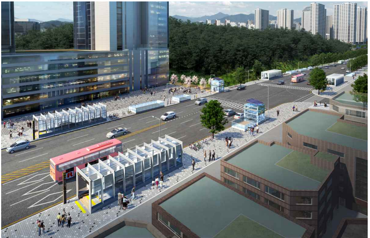
942 정거장(가칭) 조감도

※ 상기 이미지는 이해를 돕기 위한 자료로 실제 시공된 모습과는 차이가 있을 수 있습니다.