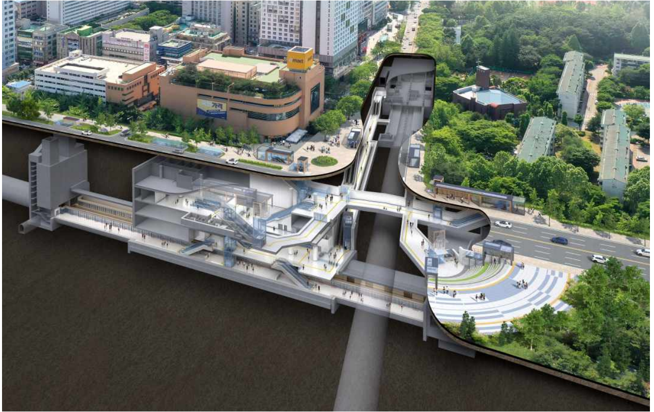
941정거장(가칭, 고덕역 환승) 투시도