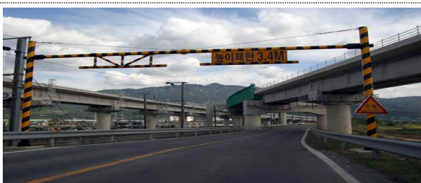
(예) 도로 상부시설 높이가 낮은 경우

- 저상버스 예외 승인이 가능한 경우는 ①해당 노선에 설치된 교량 등 도로 시설의 높이가 저상버스 높이보다 낮거나, ②도로 경사가 급격히 변화하여 저상버스 하부에 마찰이 발생하는 경우, ③그 밖에 도로 시설·구조 등 기타 사유로 인해 해당 노선이 저상버스 운행이 곤란한 경우 등이다.