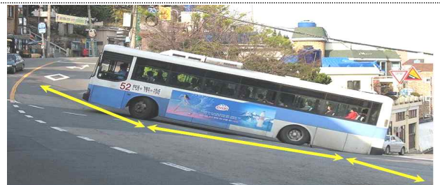
(예) 버스 하부에 마찰이 발생하는 경우

○ 예외 승인 신청을 받은 교통행정기관 은 객관적·전문적 검토를 위하여 교통약자 관련 법인·단체, 교통 전문가 의견을 청취를 거쳐 저상버스 도입 예외 여부를 결정하여야 한다(신청 40일 이내).