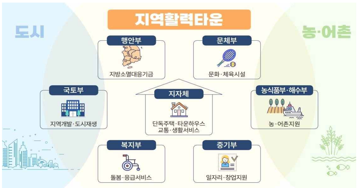
< 지역 활력타운 개념도 >