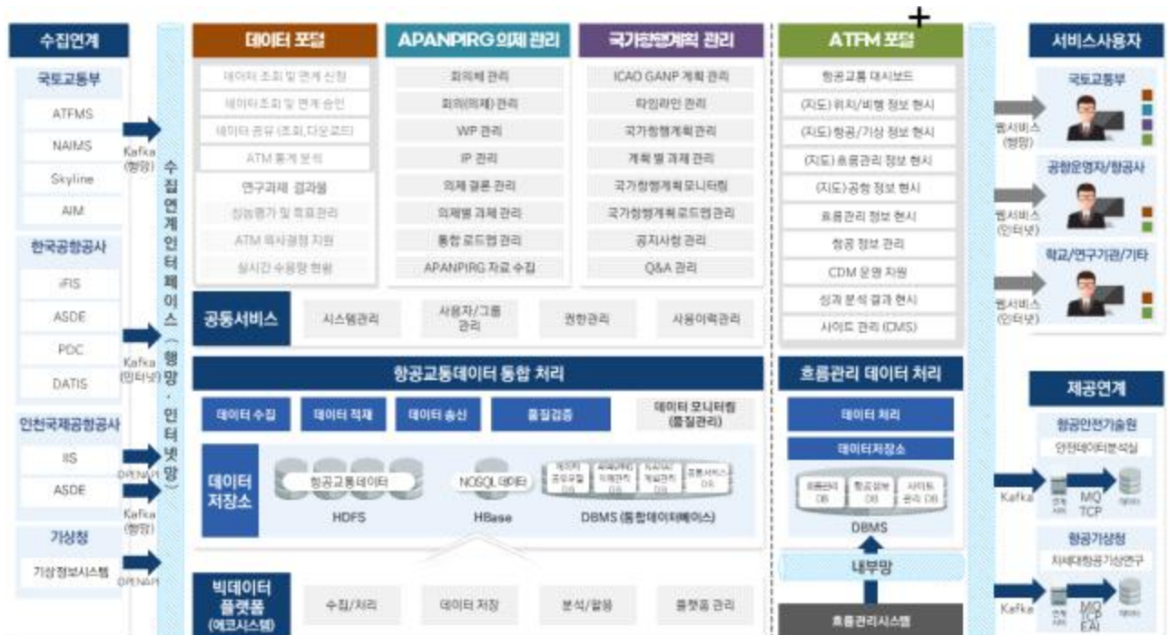
[그림 1] 항공교통데이터시스템 개념 구성