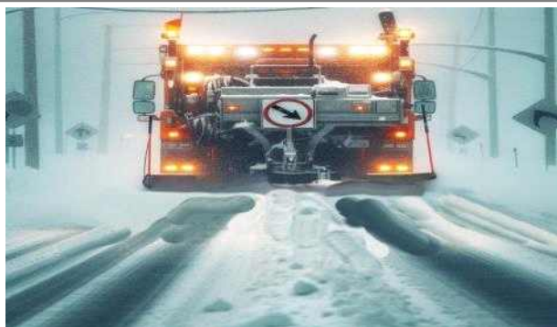
기 존 : 안전거리 확보 취약

* (고보조명) 도로노면 등에 문구, 이미지(제설 안내문구 등)를 비추는 투영식 조명 방법