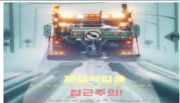
개선(안) : 교통안전효과 기대